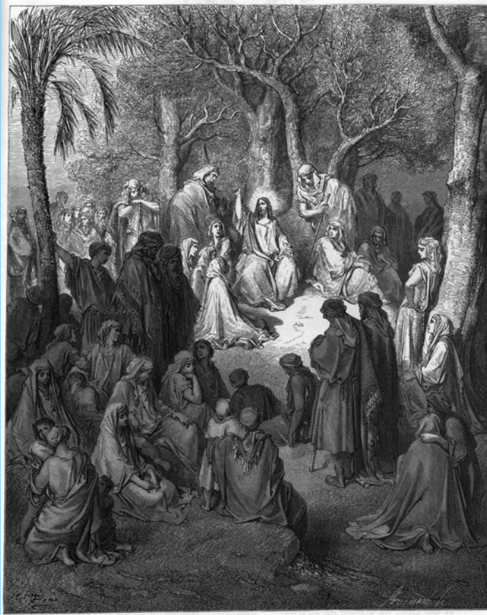
Нагорная проповедь Господа Иисуса Христа гравюра Г. Доре